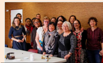
Moniteurs-trices du Groupe d'Instruction biblique (GIB)